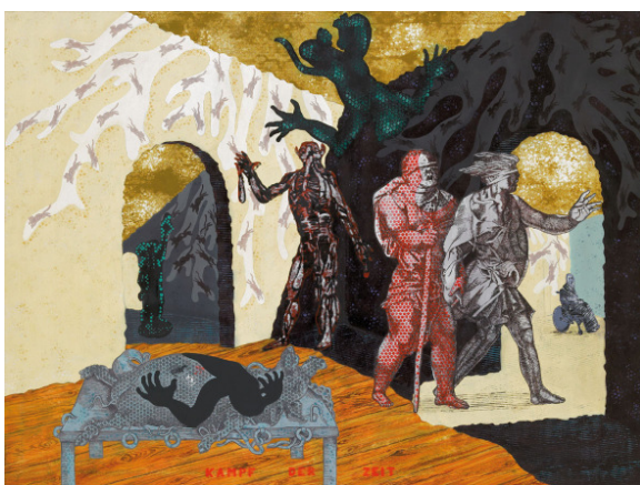
Jörg Immendorff, Kampf der Zeit, 2005

Erstmals zeigen die weltweit anerkannten Leipziger Künstler Rosa Loy und Neo Rauch, seit 1985 verheiratet, ihre Werke gemeinsam in einer großen, etwa 80 Arbeiten umfassenden, Ausstellung. Die bedeutenden Werke der Künstler in der Sammlung Essl, die den Grundstein der Schau bilden, werden durch Leihgaben und neue, noch nie gezeigte Werke direkt aus den Ateliers sowie eigens für die Ausstellung angefertigte Zeichnungen beider Künstler ergänzt.